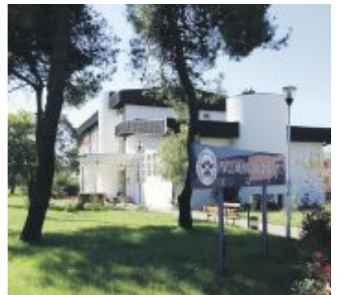
Prijemni uz primjene mjera NKT: Medicinski fakultet

roku, biće organizovano sjutra, u prostorijama te ustanove i Instituta za javno zdravlje. Prijemni ispit polažu kandidati za upis na studijske programe stomatologija i